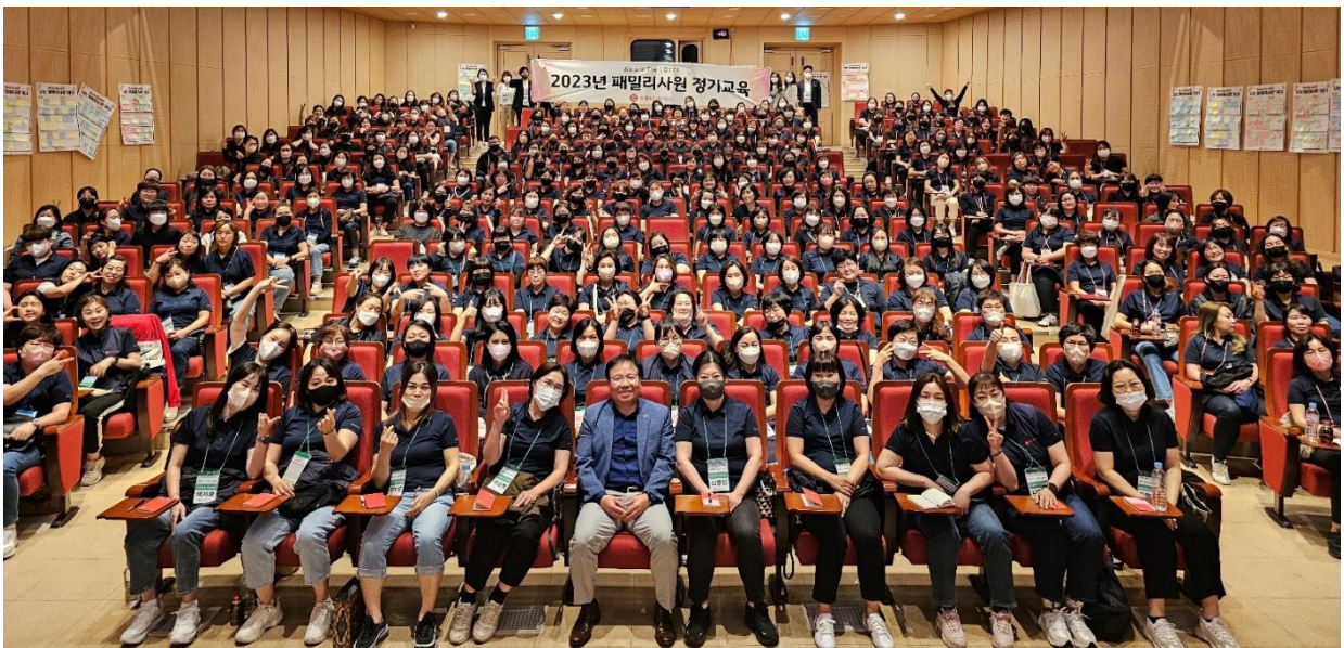
<2023년 충호지사 (대전) 정기교육 단체사진>